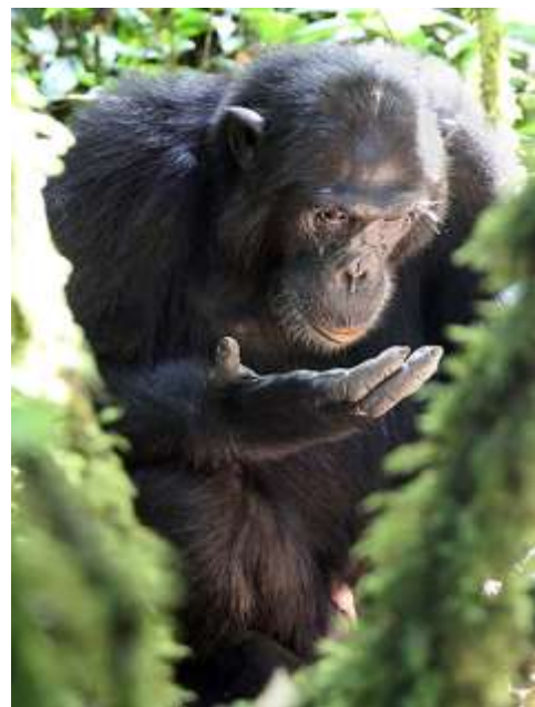
Incontro ravvicinato: si muove come noi, guarda come noi, usa le mani come noi, ma cosa penserà di noi?