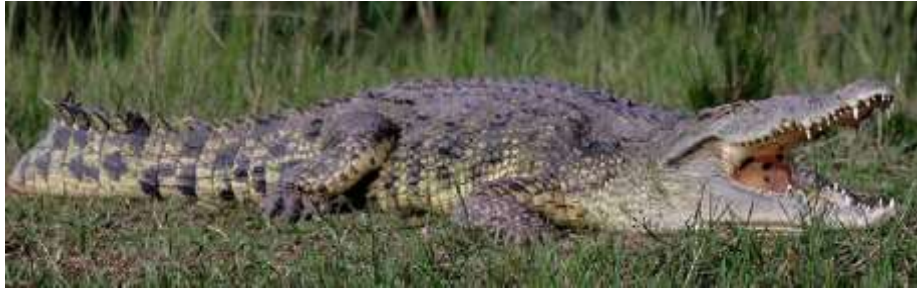
Uganda: navigando sul Nilo bianco in prossimità delle Murchison Falls, lui a poche decine di metri sulle sponde.

In compenso l'Uganda è un vero paradiso per i bird-watchers, con il maggior numero di specie di uccelli di tutto il continente. Si viaggia immersi nelle nebbie alle pendici del Rwenzori, la terza montagna più alta del continente, che meriterebbe da sola un viaggio per una impegnativa meta alpinistica. Si viaggia sempre stupiti di una terra verde, fertile, un paese non certo ricco né particolarmente progredito rispetto ad altri, ma dove non abbiamo visto miseria estrema né problemi evidenti di fame o di sopravvivenza precaria; anzi talvolta ci sembrava di entrare nel mitico shangri-la, constatando condizioni di vita semplice, ma di autosufficienza e con il solito equivoco di noi turisti occidentali che faticavamo a capire che questa vita tranquilla, quasi primordiale che tanto ci affascina, è agli antipodi delle aspettative e delle speranze di tanti giovani e giovanissimi che tendono invece a riversarsi nella metropoli, la capitale Kampala. Là perseguono il miraggio di un maggior benessere economico e dei simboli universali di autogrificazione quali cellulari, motociclette, vestiti, musica, alcol, fumo, il tutto condito con quella caratteristica africana di caos, colori, suoni e rumori, di vita vissuta per strada, che rendono unica l'Africa così come tutto il mondo extra occidentale, dal Nepal al Sudamerica.