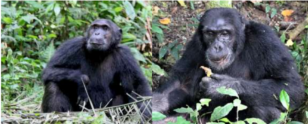
Uganda, scimpanzè nel Parco Nazionale di Kibale

quando vincono, con la coda tra le gambe se perdonano, ma sembra quasi che accampino scuse per la sconfitta e già meditano la rivincita.... sembra di ricordare qualcuno, sembra una descrizione abbastanza familiare, non è vero? talora sono anche inquietanti, perché, esattamente come gli umani, possono essere estremamente violenti nei loro scontri, fino addirittura alla morte dell'avversario, soprattutto nelle contese tra maschi per il dominio del branco.