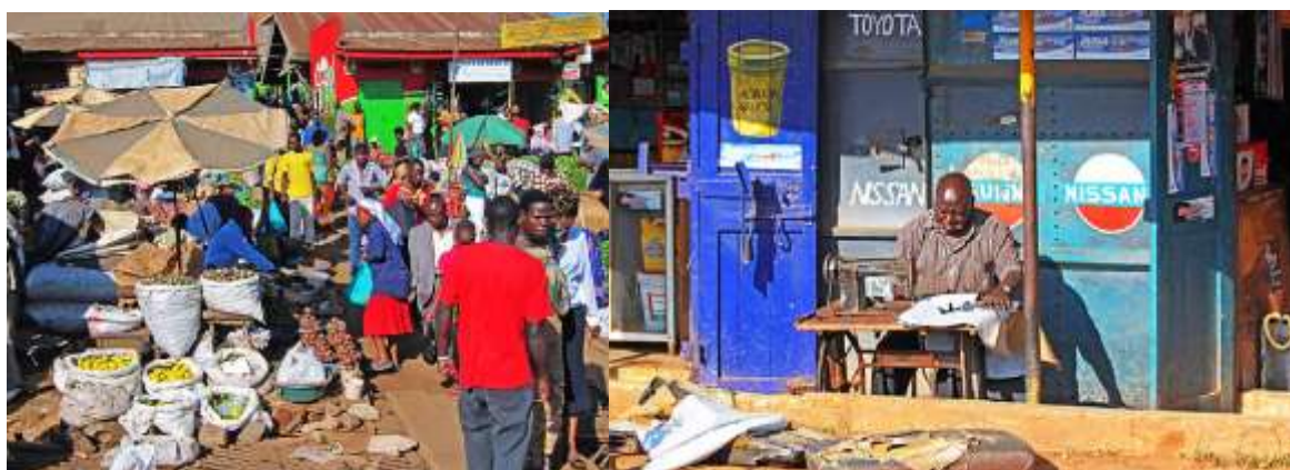
Per le strade di Kampala, capitale dell'Uganda, grande metropoli africana: caos, colori, vitalità, energia, mercati, polvere, traffico ingestibile, musica, religioni diverse, tolleranza e buonumore.

E tutto questo è pericolosissimo per l'ISIS ed è quanto l'integralismo sta cercando di distruggere nell'Africa multi-etnica e multi-religiosa, come testimonia l'attentato in un bar di Kampala un mese prima che noi partissimo, costato la vita a 130 persone che stavano guardando una partita dei mondiali di football su un megaschermo.