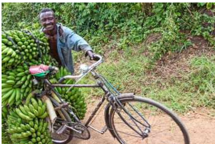
Ruanda: grande impegno in salita, un mercato da raggiungere, tanta fatica ma c'è ancora il tempo per un sorriso.

Ruanda, dove inevitabilmente e con una certa curiosità morbosa si cercavano negli occhi delle persone tracce psichiche, fisiche della tragedia di vent'anni prima, e ricevendone solo sguardi imperscrutabili, che sicuramente nascondevano storie inenarrabili e inesplicabili. Ruanda, paese ad altissimo tasso di sviluppo, nonostante e forse anche in conseguenza della strage etnica.